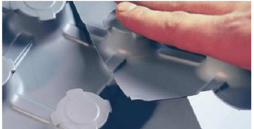
egyszerű átlapolt fektetés a stabil rögzítőfelület és párazáró réteg kialakítása érdekében