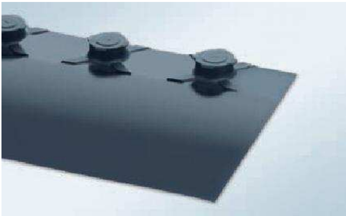
különleges kialakítás teszi még egyszerűbbé a szerelést a nehezen hozzáférhető helyeken is mint pl. ajtónál vagy osztók környékén