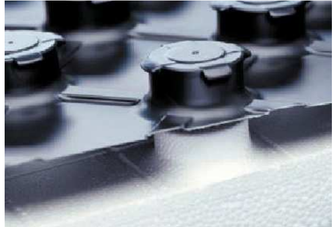
a szerelés utolsó lépéseként a polisztirol fedőréteg és a habosított polisztirol alaplemez összenyomásával a két rész erőzáró kötással rögzül egymáshoz